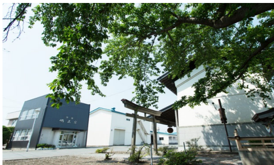
・十和田の酒蔵「鳩正宗」